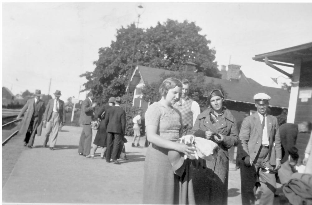
På Hoby Station.

Badlakan för uppsamling av avskedstärarna bäst och billigast i Hoby Bosättningsmagasin.